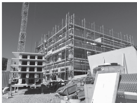
Schulhaus Wildhaus nimmt Formen an.

Das neue Primarschulhaus Wildhaus befindet sich im Bau. Bis jetzt ist der Baufortschritt sehr erfreulich. Bis zur nächsten Sommerferien werden die Bauarbeiten zur Hauptsache abgeschlossen sein.