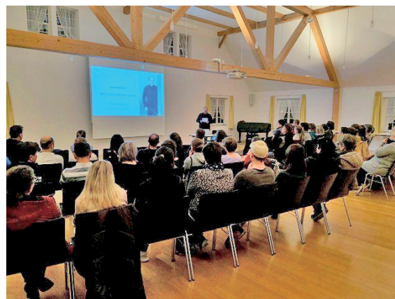
Infoanlass «Wie funktioniert unsere Schule?»

rung die moderne Schule etwas nähergebracht. Es ist heute nicht mehr der Drill, sondern vielmehr das eigenverantwortliche Lernen, das die Kinder mitnehmen sollen. Das grosse Interesse der Bevölkerung hat uns sehr gefreut, haben doch über 70 Personen an der Veranstaltung teilgenommen.