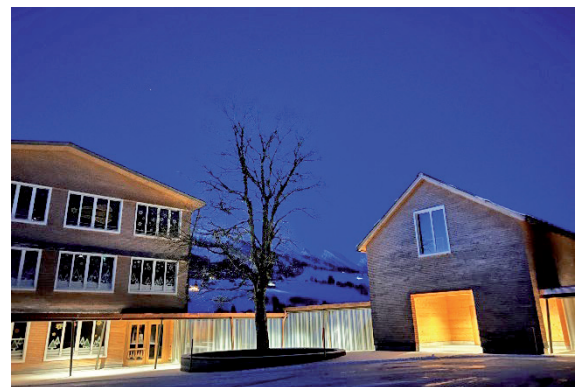
Morgenstimmung beim Schulhaus Wildhaus

Erfreulicherweise konnten bisher alle Stellen mit qualifizierten, engagierten Mitarbeitenden besetzt werden. Der Schulrat bedankt sich herzlich für den Einsatz und wünscht den ausgetretenen Personen viel Freude im neuen Arbeitsumfeld.