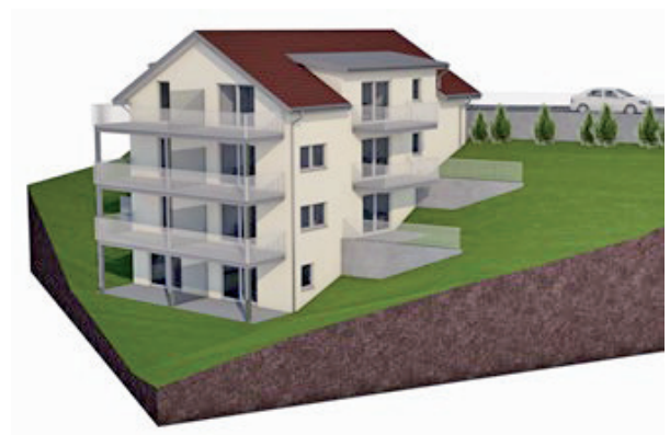
Neubau Mehrfamilienhaus, Mitarbeiterwohnungen, Klangcampus, Vordere Schwendi-strasse 54, Wildhaus