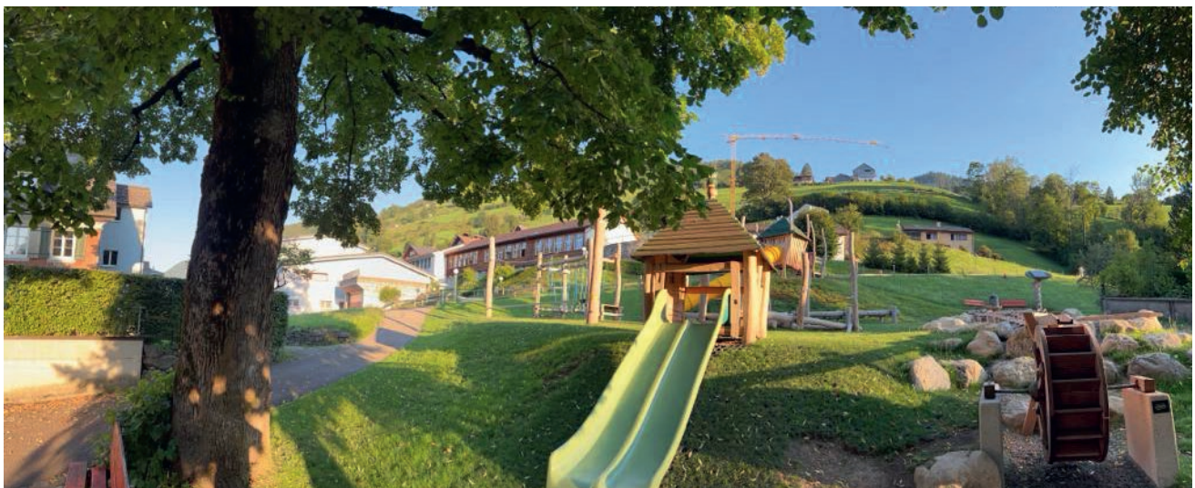
Der Spielplatz beim Schulhaus in Alt St. Johann

Der Wärmeverbund Wildhaus ist im vergan- genen Jahr wiederum gewachsen. Um zu- sätzliche Liegenschaften anzuschliessen, wurden Fr. 158'856.66 aufgewendet. Fr. 74'400.00 wurden als Anschlussbeiträge bezahlt.