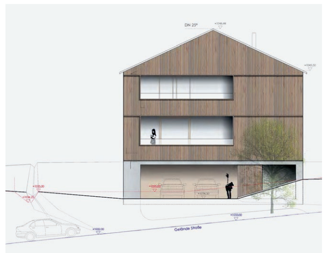
Neubau Wohnhaus, Ahornstrasse 1, Wildhaus