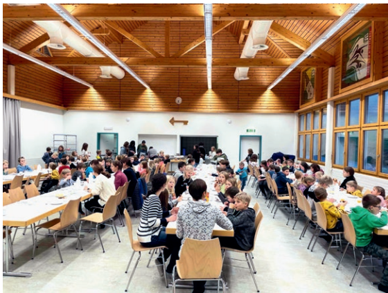
Weihnachtsmorgen in Wildhaus

Erfreulicherweise konnten bisher alle Stellen mit qualifizierten, engagierten Mitarbeitenden besetzt werden. Der Schulrat bedankt sich herzlich für den Einsatz und wünscht den ausgetretenen Personen viel Freude im (Un-)Ruhestand.