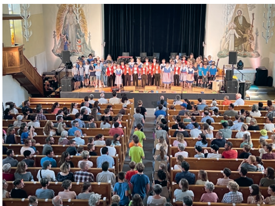
Projekt «johle und groove» zusammen mit der KlangWelt Toggenburg

Vor allem die Aufteilung des Rates in verschiedene Arbeitsgruppen sowie die digitale Organisation bringen eine grosse Effizienz mit sich. Ein weiterer Vorteil des klassischen Modelles ist die Abstützung in der Bevölkerung durch die Schulräte. Nach nochmaliger Befassung mit möglichen, anderen Strukturen kam der Schulrat zum Schluss, dass das heutige Modell passend ist.