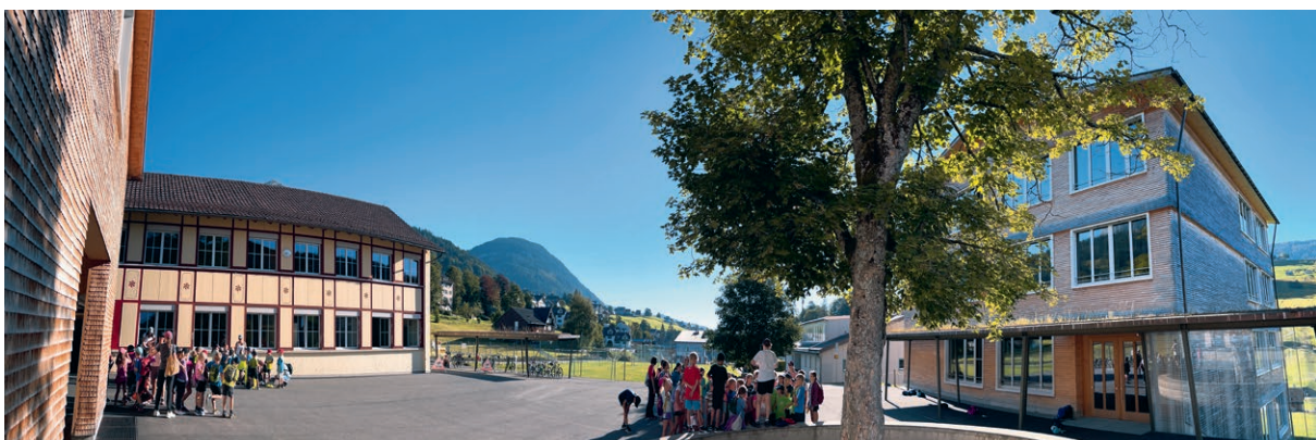
Das Schulhaus in Lisighaus