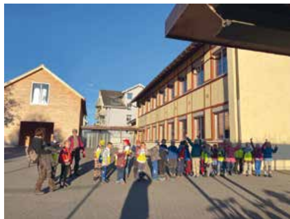
Die PS2 WH auf dem Weg in den Wald.

Etwas vom Schönsten ist, den Zusammenhalt im Team und zwischen den Schülerinnen und Schülern zu spüren. Gegenseitige Unterstützung und Toleranz hat in unserer Schule beeindruckend gut funktioniert und unterschiedliche Meinungen waren willkommen.