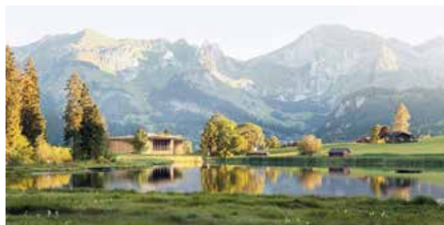
Klanghaus am Schwendisee