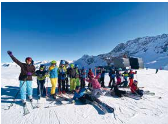
Die PS6 ASJ hat beim Projekt „bike to school“ einen Skitag in der Lenzerheide gewonnen. Super gemacht!